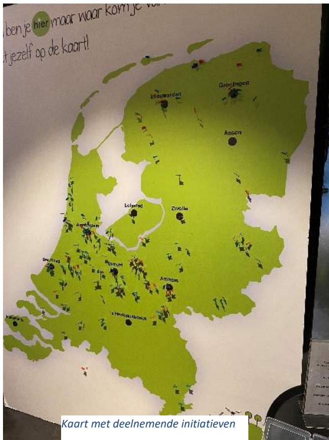
Kaart met deelnemende initiatieven

vertegenwoordigd. Voor het eerst waren alle plaatsen (1000) uitverkocht. Er waren interessante lezingen over batterijopslag, energiecongestie, financiering en samenwerkings vormen. Ook waren er stands van energie maatschappijen, banken en andere dienstverleners. Het is vooral een