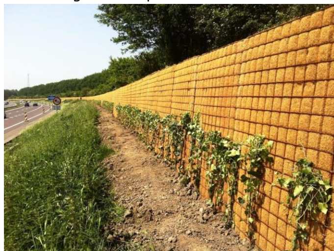
voorbeeld van een natuurlijke geluidswal

Zonnedorpen heeft de omwonenden van het Freek Sonneveld park in 't Zandt geïnformeerd over de voorgenomen uitbreiding van het park met 3000 m 2 en de